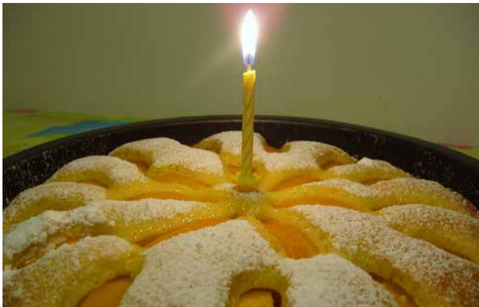
Těšíme se, že další svíčky budou přibývat.

Česká metodika hodnocení spolehlivosti vznikala s využitím informací, podkladů a předaných zkušeností od našich partnerů ve Švýcarsku, Německu a Španělsku. Zároveň důsledně zohledňuje specifika českého neziskového sektoru a další místní souvislosti. Díky mezinárodnímu partnerství jsme se dozvěděli více o činnosti mezinárodní asociace International Committee on Fundraising Organizations (ICFO), která sdružuje jednotlivé autority provádějící obdobná hodnocení v 18 zemích světa. Brzy jsme začali o členství v ICFO též usilovat. Nyní je AVPO ČR druhým rokem přidruženým členem ICFO. Přináležetost k ICFO zdaleka není jen záležitostí prestiže, ale především je garancí, že i české