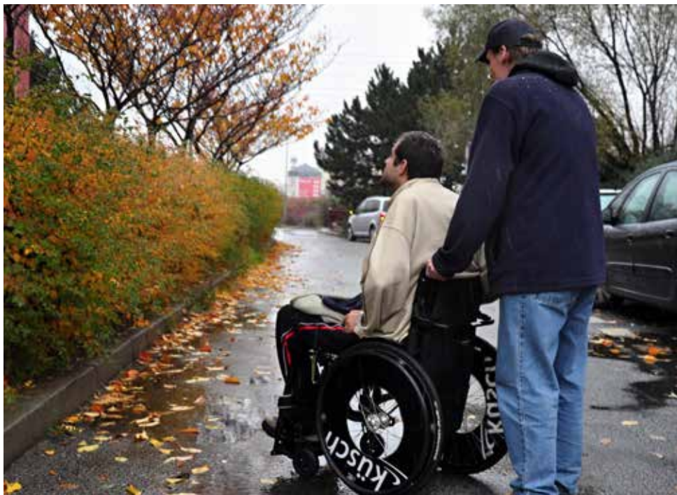
Umožňujeme lidem s tělesným postižením samostatný život.

občanské sdružení Klub vozíčkářů Petýrkova, které provoz službu nadále zajišťovalo. V oblasti poskytování terénní sociální péče tak patříme v ČR mezi první organizace, které podobné služby začaly poskytovat. Velký přelom v naší práci znamenal rok 2004, kdy došlo k profesionalizaci armády, a tedy ke zrušení civilní služby. Poskytování služby se nám podařilo zachovat, byť se její zajištění stalo finančně mnohem náročnější. V roce 2013 jsme prošli důležitou změnou právní formy, z původního občanského sdružení jsme se transformovali na obecně prospěšnou společnost.