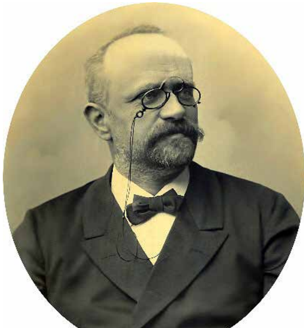
Mezi komunálními politiky se vždy našli sympatáci. August Wieser, starosta Brna v letech 1894–1916.

Z neúspěšnějších projektů v jednotlivých kategoriích vybere odborná komise celkového vítěze, přičemž osobnost, která je hlavním nositelem tohoto projektu, obdrží titul Komunální politik roku 2015.